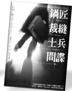
《鍋匠 裁縫 士兵 間諜》