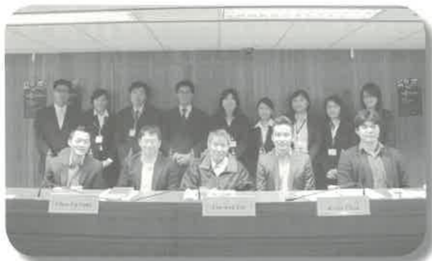
2012年台灣區區域賽，外交系代表隊以初賽積分第一名之姿進入複賽。圖為與對手及法官之合照。

2012年外交系代表隊，在經過將近一年的籌備與訓練之後，終於在全國拿下季軍的殊榮，除了榮譽之外，更證明了傑賽普是個非常適合外交系學生參加的活動。準備期間的腦力激盪，以及比賽期間與法官的激烈答辯，除了急速精進英文能力、深入學習與活用國際法知識之外，更能夠在國內體驗到國際級水準的比賽內容。誠摯希望外交系的同學們，倘若對國際法有興趣，一定要嘗試看看！